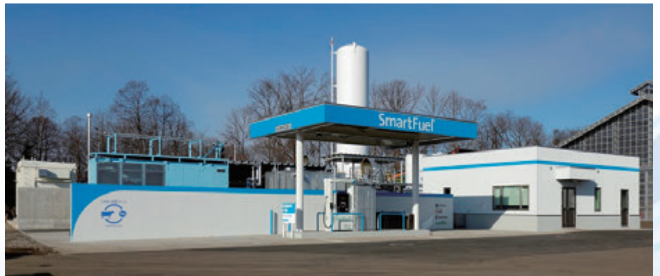
環境省による実証事業・家畜バイオマス由来の水素製造供給施設「しかおい水素ファーム®」水素ステーション